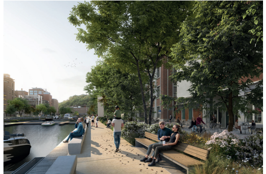
Banken aan de waterkant aan de noordoever.